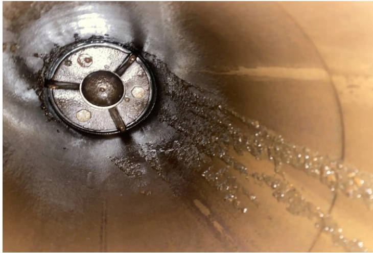
Фотография 1 – Корпус универсального сливного прибора.

Для исключения дальнейшей утраты груза, внутренний клапан универсального прибора был подтянут на 3/4 оборота.